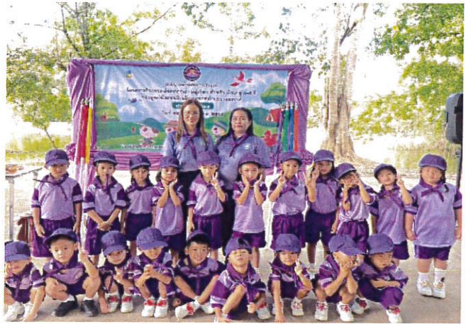
โครงการพัฒนาศักยภาพเด็ก ศพด.ทต.บางสวรรค์