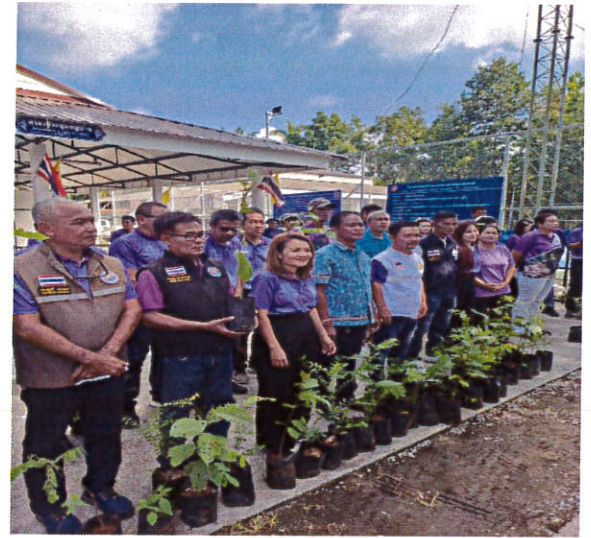
โครงการปลูกต้นไม้ในวันต้นไม้แห่งชาติ