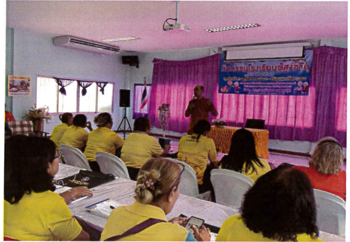
โครงการ โรงเรียนผู้สูงอายุ ประจำปี ๒๕๖๘