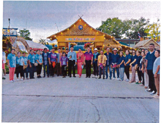
โครงการพระแสงรำลึก ปี ๒๕๖๘