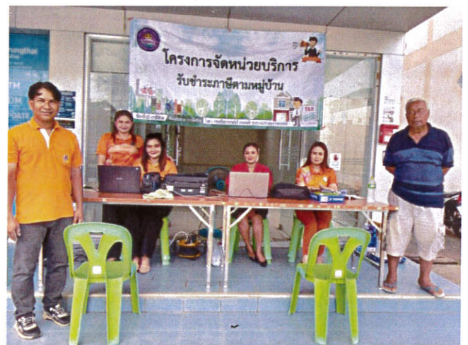
โครงการจัดหน่วยบริการรับชำระภาษีตามหมู่บ้าน