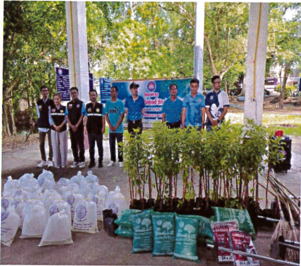
โครงการรวมใจภักดี รักษาพื้นที่สีเขียว