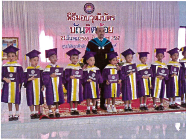
พิธีมอบวุฒิบัตรบัณฑิตน้อย