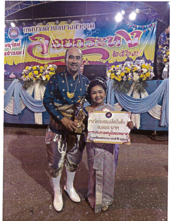
โครงการจัดงานลอยกระทง ปิงปประมาณ ๒๕๖๘