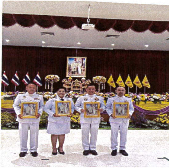
เข้ารับภาพพระราชทานของพระบาทสมเด็จพระเจ้าอยู่หัว และสมเด็จพระนางเจ้าสุทิดาพัชรสุธาพิมลลักษณ พระบรมราชินี