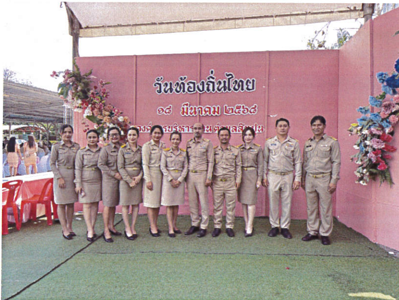
โครงการวันท้องถิ่นไทย ปี ๒๕๖๘