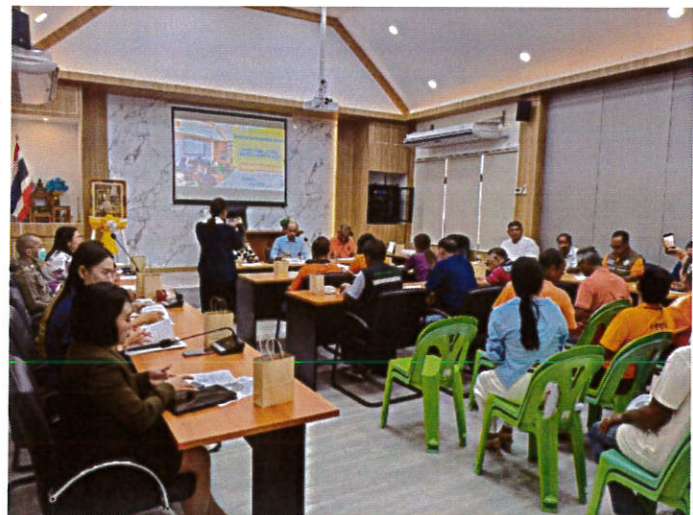
โครงการจัดทำแผนพัฒนาท้องถิ่น ปี ๒๕๖๘