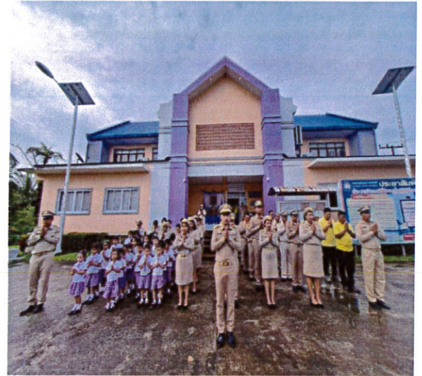
กิจกรรมวันธงชาติไทย