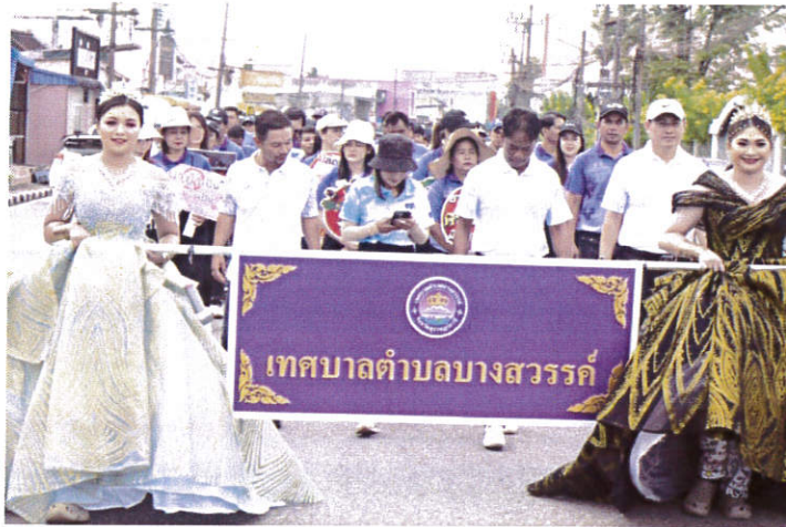
โครงการกีฬาอำเภอพระแสง ๒๕๖๘