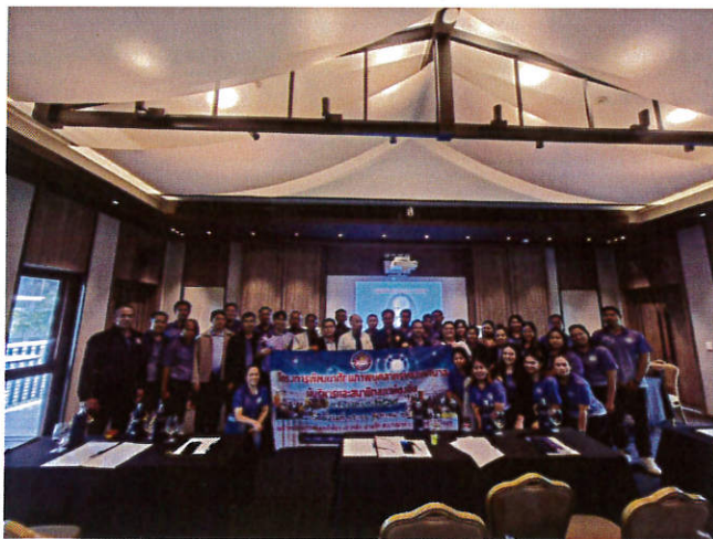
โครงการพัฒนาศักยภาพบุคลากรของเทศบาล ผู้บริหาร และสมาชิกท้องถิ่น