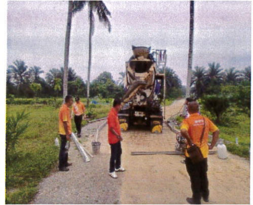
ก่อสร้างถนนคอนกรีตสายโรงเรียนอนุบาลเพ็ญจรรัส หมู่ที่ ๓ ตำบลบางสวรรค์