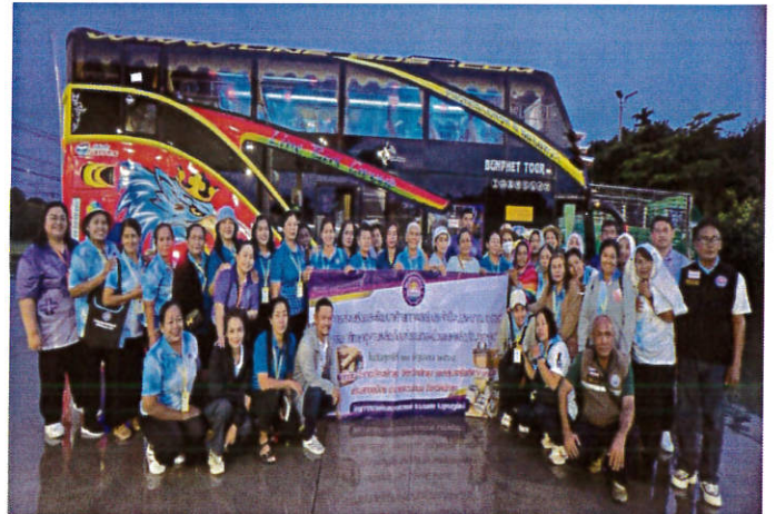
โครงการศึกษาดูงานคณะกรรมการชุมชน คณะกรรมการสตรีและอสม. ประจำปีงบประมาณ ๒๕๖๘