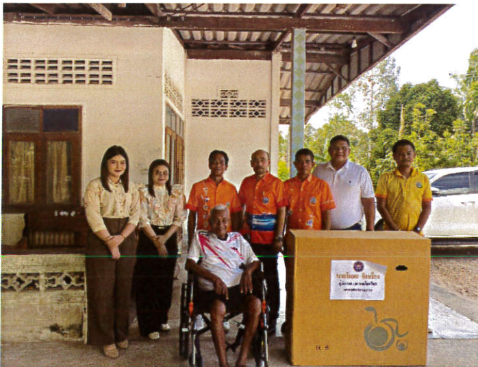
มอบวีลแชร์ให้ผู้พิการในพื้นที่