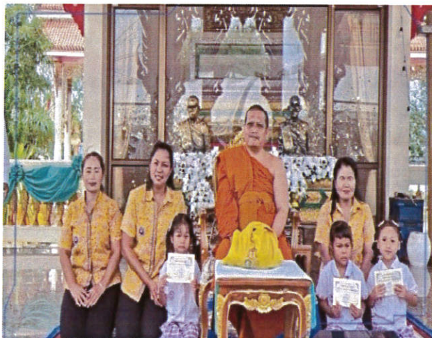
เด็กนักเรียน ศพด.ทต.บางสวรรค์ รับทุนการศึกษา จากเจ้าอาวาสวัดบางสวรรค์