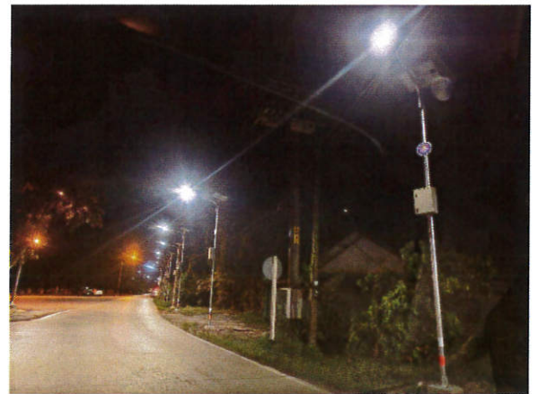
โครงการติดตั้งไฟส่องสว่างโซล่าเซลล์ ๒๐๐ ชุด ในเขตเทศบาลฯ