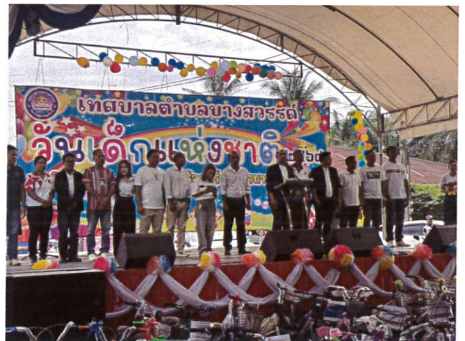
โครงการวันเด็กแห่งชาติ ๒๕๖๘