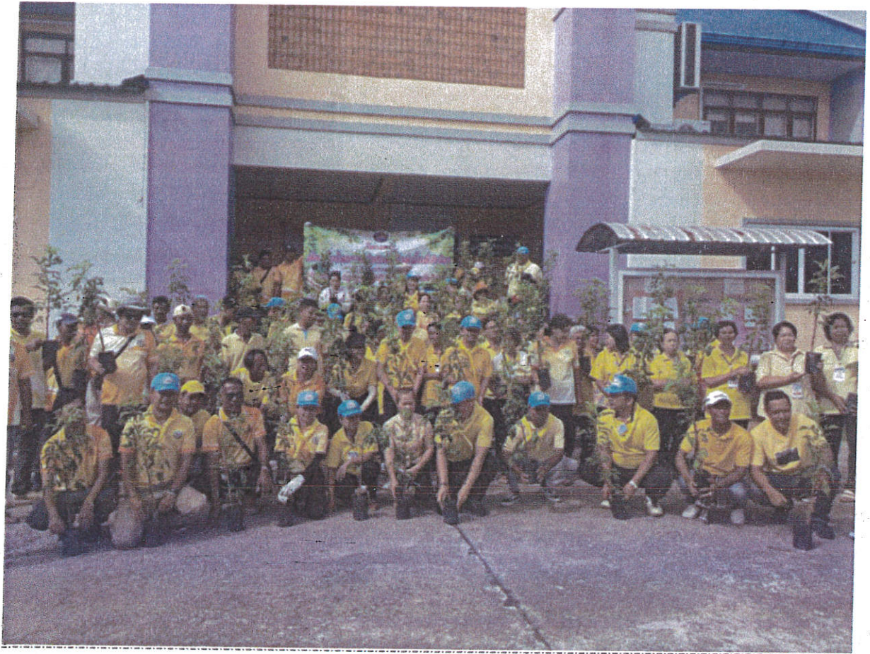
ปลูกต้นไม้ เนื่องในวันแม่แห่งชาติ 12 สิงหาคม 2567