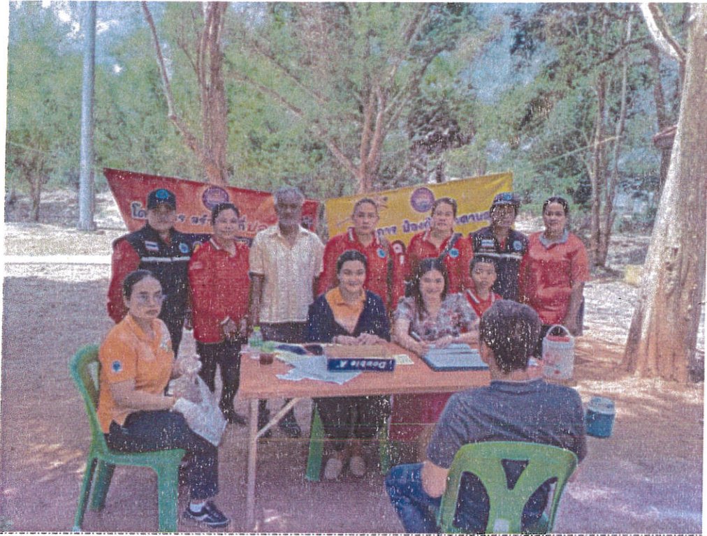
ออกฉีดวัคซีนป้องกันโรคพิษสุนัขบ้า